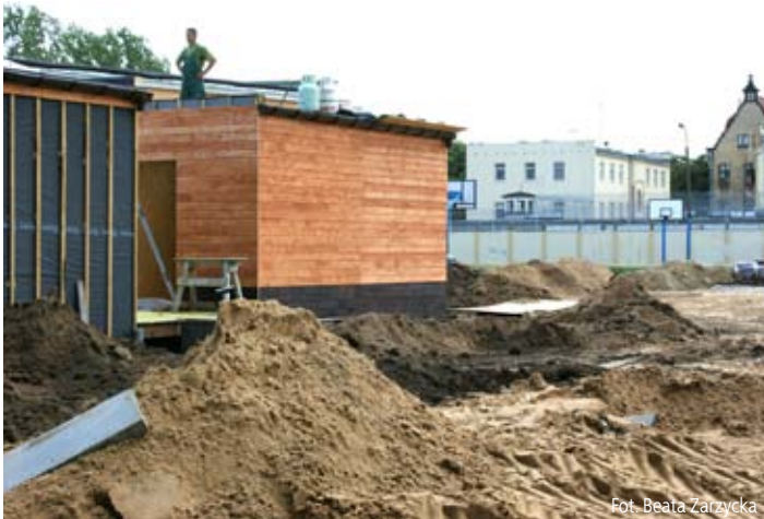
Fot. Beata Zarzycka