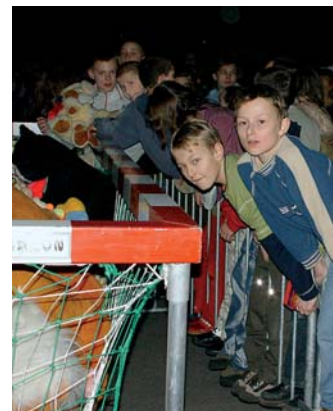
Zebrano ponad 6000 maskotek.