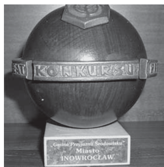
Statuetka, którą miasto wyróżniono.

ZDROWIE. Proste plecy dzieci i młodzieży