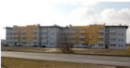
Pierwszy blok socjalny przy ul. Wojska Polskiego.

- budowa budynku socjalnego przy ul. Wojska Polskiego, w którym będzie 76 mieszkań. Lokale na parterze zostaną przystosowane do potrzeb osób niepełnosprawnych w zakresie budowlanym. Obecnie trwają prace budowlane. Warto przypomnieć, że będzie to drugi blok socjalny wybudowany przy ul. Wojska Polskiego, - zakup mieszkań na rynku wtórnym oraz zakup lokali na rynku wtórnym.