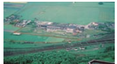
Zdjęcie „z góry” rejonu ul. Pakoskiej,

- rewitalizacja centrum miasta: m.in. Teatr Miejski i plac Klasztorny, - rozbudowa i rewitalizacja Parku Solankowego, - budowa w Parku Solankowym ujęcia wód mineralnych (prace rozpoznawcze), - Inowrocławski Obszar Gospodarczy (I etap).