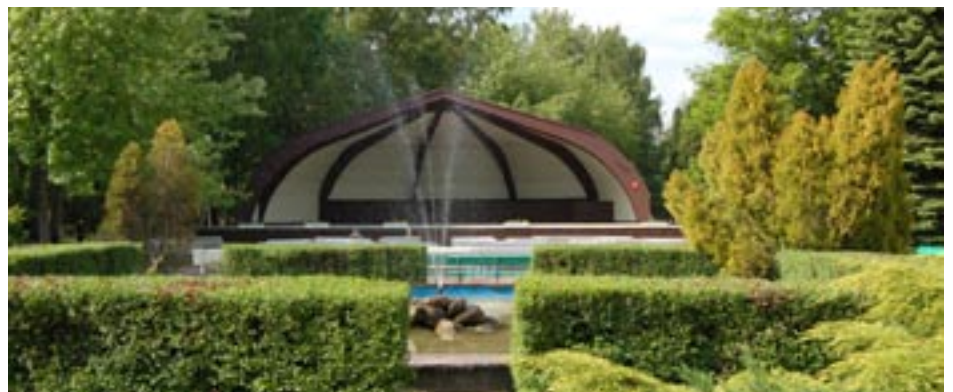
W ramach rewitalizacji Parku Solankowego planowane jest m.in. przesunięcie fontanny zlokalizowanej w pobliżu Muszli Koncertowej.

- Gimnazjum nr 1 – remont dachu i elewacja budynku sali gimnastycznej, - Gimnazjum nr 2 – wymiana stolarki drzwiowej oraz oświetlenia w salach lekcyjnych, - Gimnazjum nr 3 – remont w sali gimnastycznej (malowanie), - Gimnazjum nr 4 – położenie kostki brukowej przed wejściem głównym do szkoły, - Szkoła Podstawowa nr 2 – remont części schodów wewnętrznych, montaż monitoringu obiektów szkoły, - Szkoła Podstawowa nr 4 – kapitalny remont korytarzy i klatek schodowych, - Szkoła Podstawowa nr 6 – położenie kostki brukowej przed budynkiem szkoły, - Szkoła Podstawowa nr 9 – termomodernizacja, - Szkoła Podstawowa nr 10 – termomodernizacja, - Szkoła Podstawowa nr 11 – kapitalny remont sali gimnastycznej i zaplecza, - Przedszkole nr 2 – remont kapitalny sal, - Przedszkole nr 14 – termomodernizacja w budynku przy ul. Poznańskiej, wymiana instalacji elektrycznej i częściowa wymiana okien w budynku przy ul. Jacewskiej, zmiana elewacji budynku przy ul. Marii Curie-Skłodowskiej,