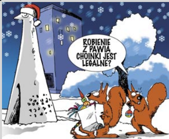
Rys. Jarosław Wojtaszkiński