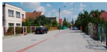
Tak po zakończeniu przebudowy prezentuje się ulica Jaśminowa.

Poza tym kontynuowane są prace przy budowie basenu krytego zlokalizowanego w pobliżu Gimnazjum nr 1 oraz przy budowie drugiego, trzeciego i czwartego segmentu budynku socjalnego przy ulicy Wojska Polskiego.