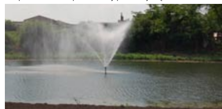
Fontanna, która w przeszłości znajdowała się na małym stawie w Parku Solankowym, zainstalowana została na zrehabilitowanym niedawno stawie w pobliżu ulic Leona Czarlińskiego i Edwarda Ponińskiego.