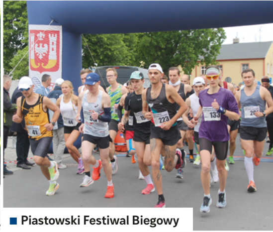
■ Piastowski Festiwal Biegowy