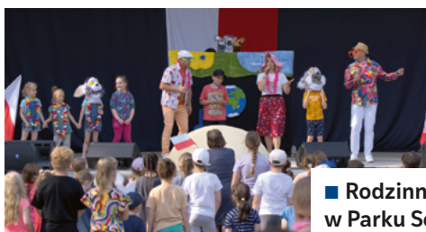
■ Rodzina Majówka w Parku Solankowym