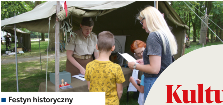
■ Festyn historyczny