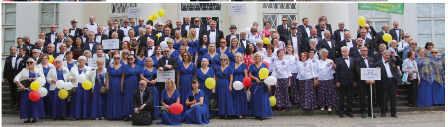
■ 45. Przegląd Artystyczny Chórów Województwa Kujawsko-Pomorskiego WIOSNA W SOLANKACH