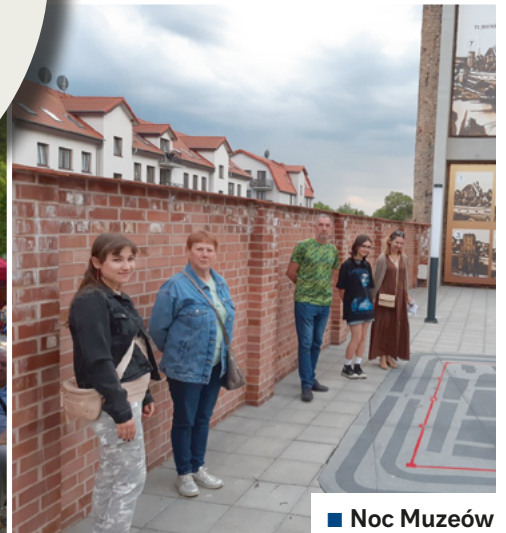
■ Noc Muzeów