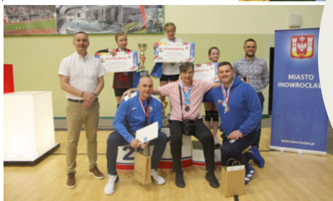
■ Finał Mistrzostw Województwa Kujawsko-Pomorskiego w Minisiatkówce Dziewcząt w kat. „Single”