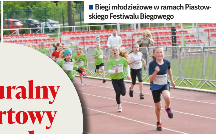
■ Biegi młodzieżowe w ramach Piastowskiego Festiwalu Biegowego