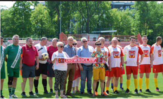
▲ Mecz Radni, Urzędnicy, Politycy kontra mieszkańcy