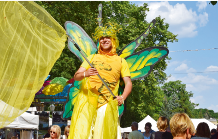
◀ Jarmark Kujawski w Parku Sołankowym