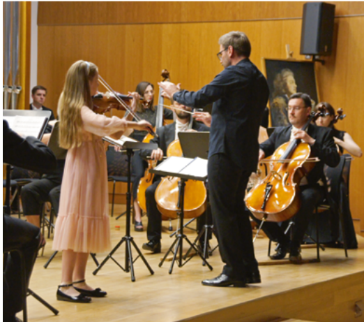
◀ Koncert Symfoniczny „Uczniowie Miastu” ▼ Dni Inowrocławia