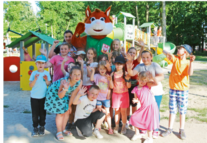
▶ Dzień Dziecka na miejskich placach zabaw