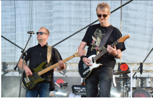
▲ Część koncertową Dni Inowrocławia rozpoczął występ Rock'n'Rollers