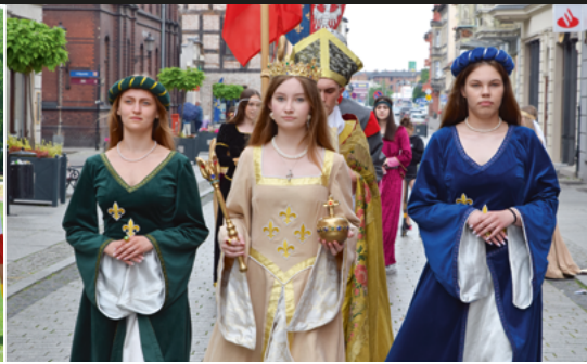
▲ Święto Królowej Jadwigi