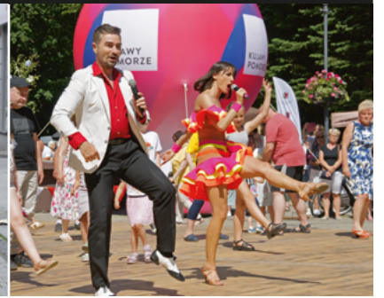
▲ Święto Województwa Kujawsko-Pomorskiego