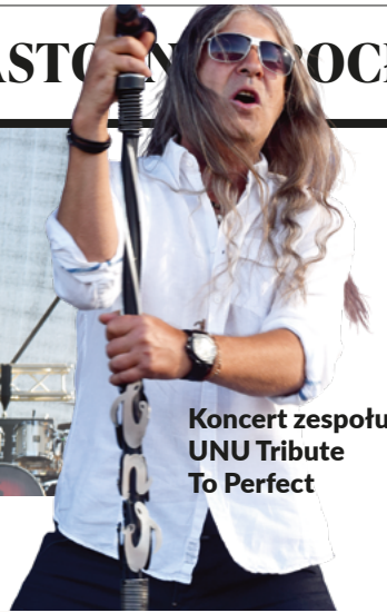
Koncert zespołu UNU Tribute To Perfect