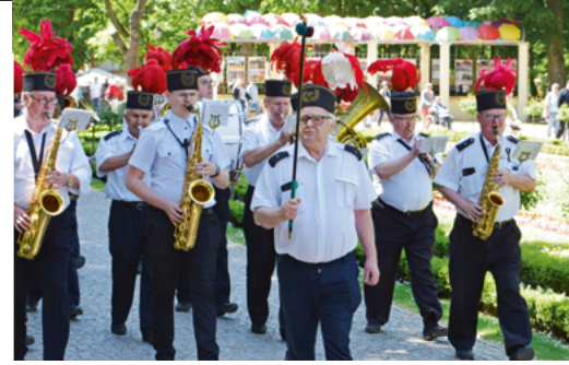
▲ W Parku Solankowym zagrały instrumenty dęte