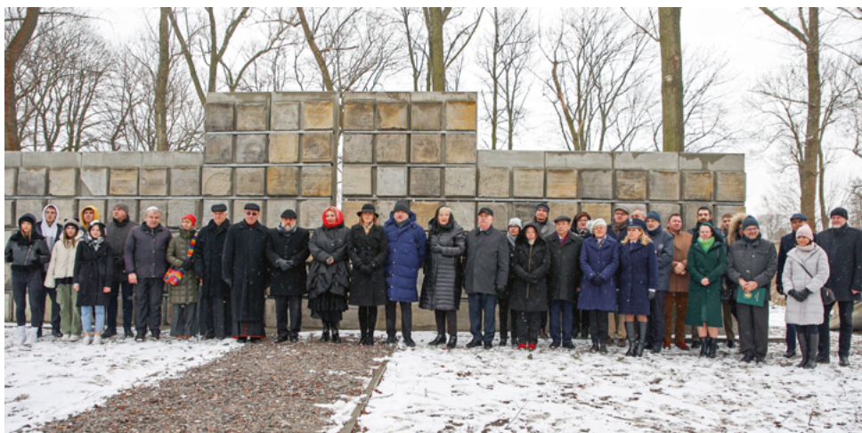
■ Zdjęcie z powiatowej uroczystości otwarcia kolejnego lapidarium

Straż Miejska: całodobowo 52 355 52 81. Wydział Gospodarki Komunalnej, Środowiska i Rolnictwa: dni powszednie w godz. 7:30-15:30 pod numerem tel.: 52 355 52 48. ■