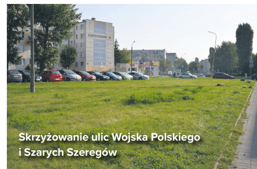
Skrzyżowanie ulic Wojska Polskiego i Szarych Szeregów