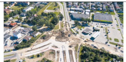
Budowa ronda turbinowego z lotu ptaka

Bagiennej - od skrzyżowania z ul. Poznańską do skrzyżowania z ul. Staropoznańską oraz oświetlenia dedykowanego przejścia dla pieszych na wysokości ul. Kamiennej).