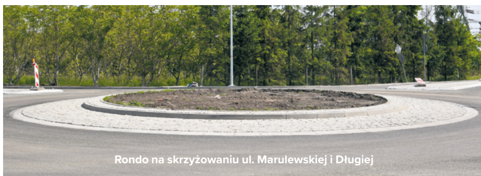
Rondo na skrzyżowaniu ul. Marulewskiej i Długiej

Przy drodze powstały również miejsca parkingowe. Odcinek oświetlają nowoczesne lampy LED. W związku z realizacją zadania, można było przeprowadzić długo wyczekiwaną inwestycję - remont ulicy za cmentarzem (fragment ul. Długiej od skrzyżowania z ul. Lipową, aż do skrzyżowania z ul. Marulewską). Droga ta ma m.in. nawierzchnię bitumiczną, ciąg pieszo-rowerowy, pas postojowy oraz nowe oświetlenie LED-owe. ■