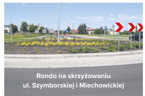
Rondo na skrzyżowaniu ul. Szymborskiej i Miechowskiej

inwestycji wybudowano jezdnię, chodnik oraz ścieżkę rowerową.