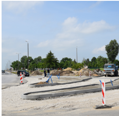
Skrzyżowanie ul. Górnicy z ul. Szymborską

Prowadzone aktualnie prace podziemne są istotną częścią tej inwestycji – przebudowywana sieć kanalizacji deszczowej w ul. Górnicy i ul. Poznańskiej oraz nowo wybudowa-