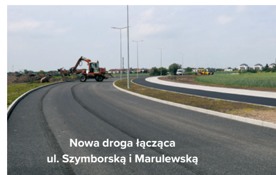
Nowa droga łącząca ul. Szymborską i Marulewską