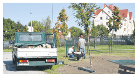
Ruszyła budowa psiego parku w Inowrocławiu