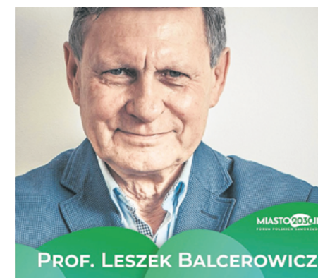
PROF. LESZEK BALCEROWICZ

Forum Polskich Samorządów Miasto2030.IN to przede wszystkim wymiana doświadczeń, poglądów, debat i dyskusji. Jest to jednocześnie możliwość zapoznania się z technologiami i usługami, które wprowadzane do polskich miast i gmin w istotny sposób poprawiają nasze codzienne życie. 18 września Hala Widowiskowo-Sportowa przy al. Niepodległości 4 stanie się przestrzenią dyskusji oraz strefą expo, w której innowacyjne i nowoczesne firmy z regionu i kraju zaprezentują swoje produkty oraz usługi. Uczestnicy Forum, jak i mieszkańcy będą mogli zapoznać się m.in. z rozwiązaniami dotyczącymi nowoczesnych form płatności First Data, elektrycznymi pojazdami, trendami telekomunikacyjnymi oraz w obszarach bezpieczeństwa. Swoją ofertę zaprezentują także inowrocławscy przedsiębiorcy – m.in. Inter Metal, Poli, Screen-LED, Solanki Uzdrawisko Inowrocław czy Souvre Internationale.