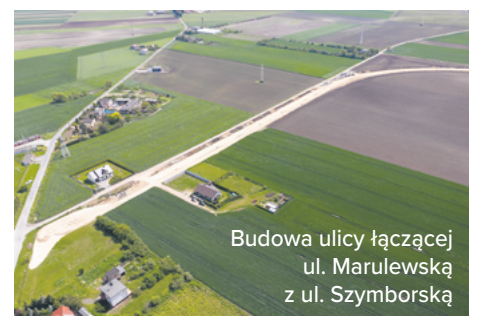
Budowa ulicy łączącej ul. Marulewską z ul. Szymborską